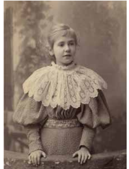
希格瑞德·朱瑟柳斯

希格瑞德·朱瑟柳斯陵墓是芬兰波里的重要文化遗址。这座陵墓建于 1901-1903 年，是一件代表了当时的艺术和工艺的杰作。陵墓的墙为砂岩墙，室内还装饰着丰富的壁画，因此非常难以保存。在该建筑完工的最初几年里，原始壁画由于吸附了过多水分而遭到破坏，后来进行了重新绘制。希格瑞德·朱瑟柳斯基金会拥有该建筑的所有权，也负责管理该建筑，为了持续准确地监测其中的湿度和温度，让这座出色的建筑物保持在良好的状态，基金会最近购买了维萨拉的最新技术。