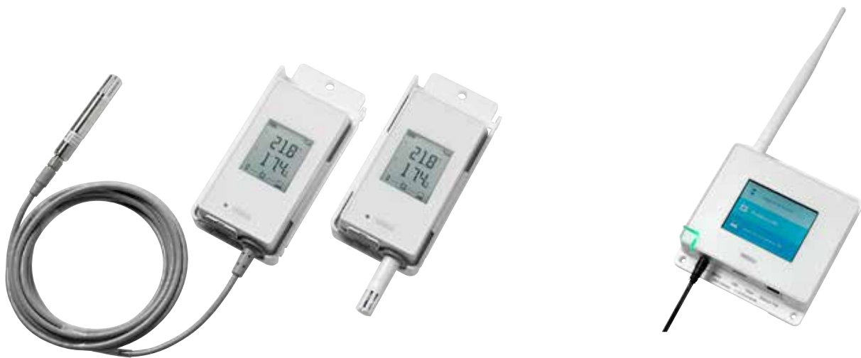
用于受控区域的无线监测的 Vainet 无线温湿度数据记录仪 RFL100