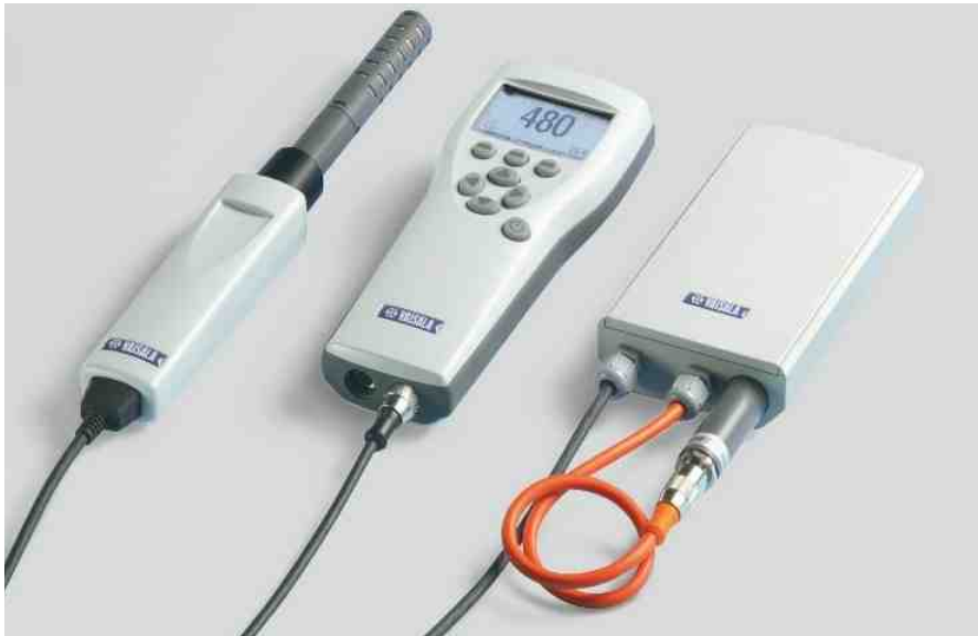
维萨拉CARBOCAP®手持式二氧化碳测量仪GM70是要求苛刻的专业人士的首选。仪表由显示表头(中)和探头组成,可以带手柄(左),也可以带抽气泵(右)。